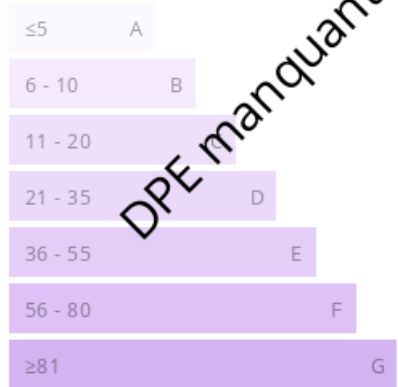
Forte émission de GES (kg CO2/m².an)